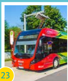
23 E-Bus Anbindung mit Ladestation Hagen-Süd