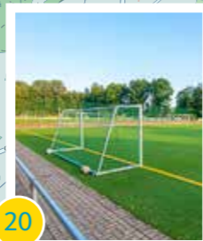
20 Erweiterung Sportanlage „Im Stern“