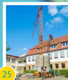
25 Umbaumaßnahmen Ganztagsangebot an Grundschulen