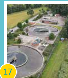
17 Modernisierung der Kläranlage