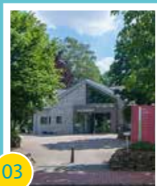
03 Finanzieller Zuschuss zur Sanierung des Martinusheims