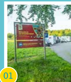
01 Aufwertung des Reisemobilstellplatzes und Kirschlehrpfades