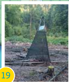
19 Kampf gegen den Borkenkäfer