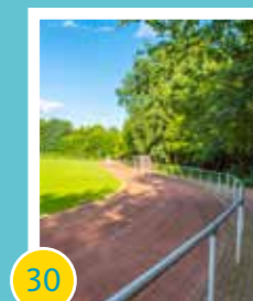
30 Tartanbahn im Sportzentrum Obermark