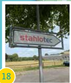
18 Ansiedlung Stahlotec