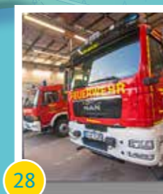
28 Modernisierung der Feuerwehren