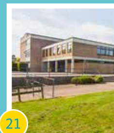
21 Energetische und digitale Schulsanierungen