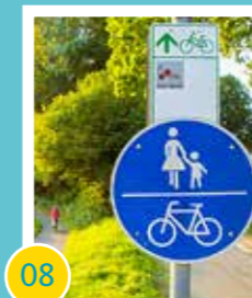
08 Bau des Radweges nach Bad Iburg