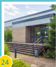
24 Sanierung der Sporthalle im Schulzentrum