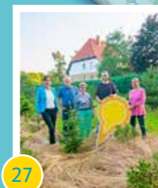
27 Anlegung ökologischer Naherholungspfad