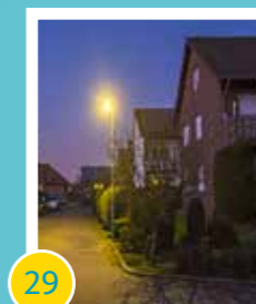
29 Austausch von Straßenlampen auf LED-Technik