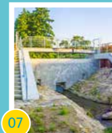
07 Bau des Forellentaldamms