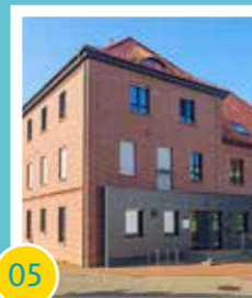
05 Ortskernsanierung – Erwerb, Sanierung und Umbau Jahnstr. 4