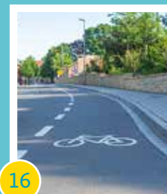
16 Ausbau „Alte Straße“