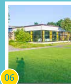
06 Sanierung des Hallenbades