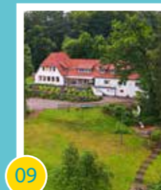
09 Erwerb des Schullandheims