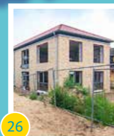
26 Neubau Freizeiteinrichtung „Zum Jägerberg 6“