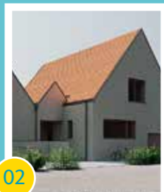
02 Zuschuss zum Neubau des Gustav-Görsmann-Hauses